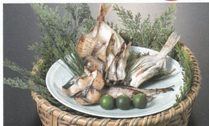
写真は盛り付け事例であり、実際の景品と異なる場合があります