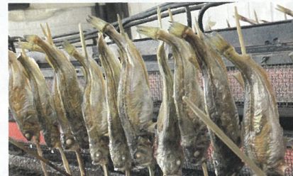
写真は事例であり、お店により扱う商品が変わります

主催/鶴岡食文化創造都市推進協議会 問合せ/鶴岡食文化創造都市推進協議会 事務局 (魚食担当: 鶴岡市農山漁村振興課) ☎0235-25-2111(内線597)